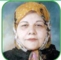
فقط او باقیست