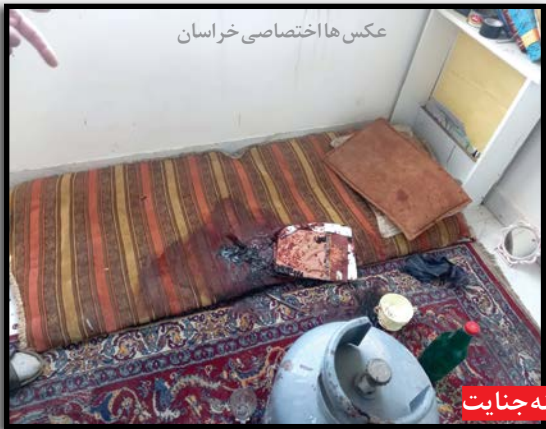
تصاویری از صحنه جنایت

بنابر گزارش روزنامه خراسان، با افشای راز این جنایت و دست نوشته های خون آلود، تحقیقات از دو متهم این پرونده جنایی وارد مرحله جدیدی شده است.