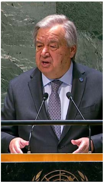
دبیر کل سازمان ملل در مراسم یادبود رئیس جمهور