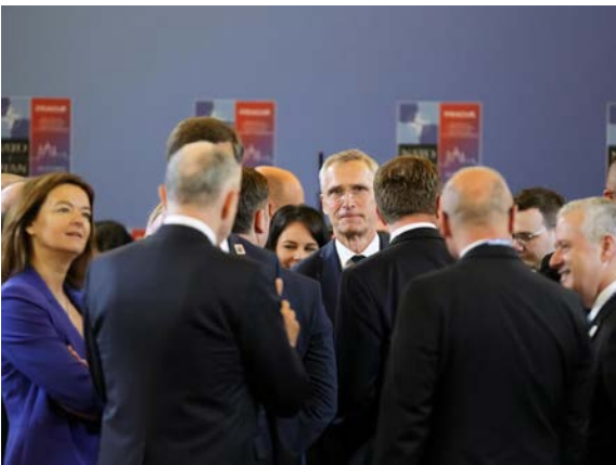
حمایت آلمان، هلند، فنلاند و لهستان از حمله به خاک روسیه و مخالفت ایتالیا