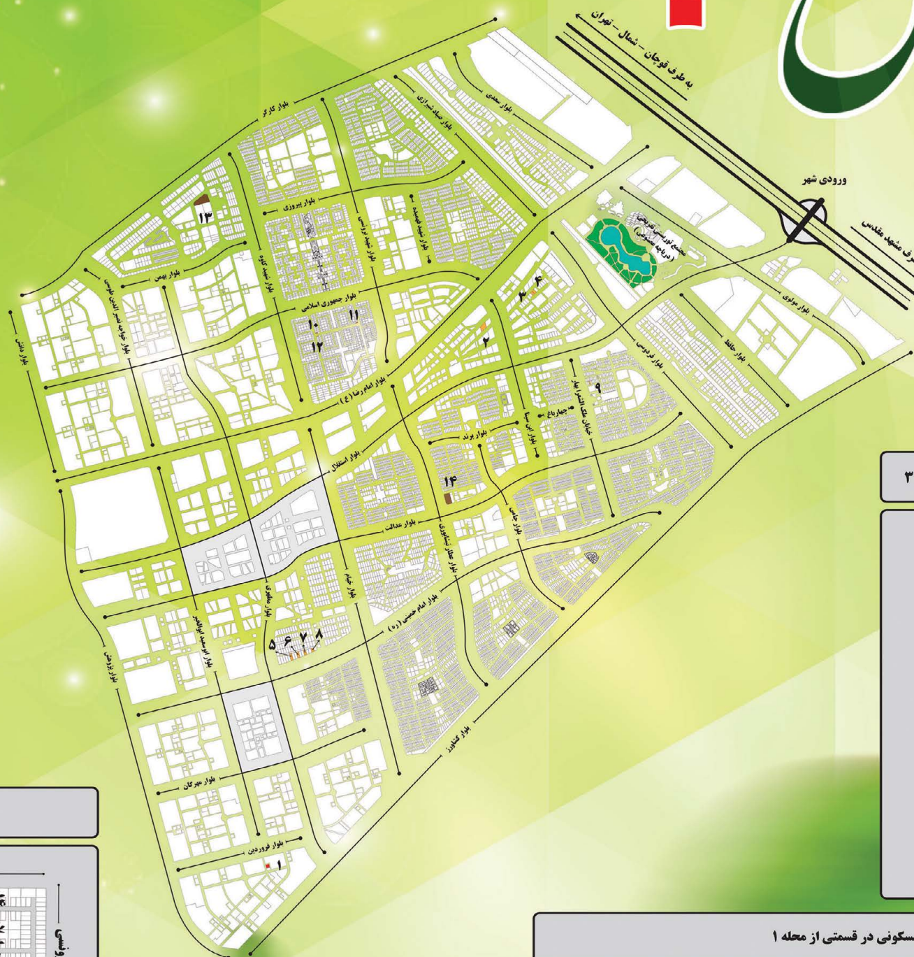
پلان جانمایی قطعه بهداشتی درمانی واقع در قسمتی از محله ۳۱