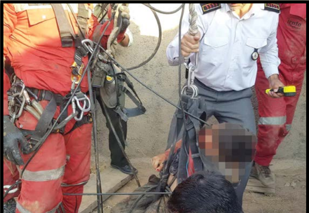
تصویری از تلاش امدادگران اورژانس و آتش نشانی برای بیرون کشیدن پیکر کودک