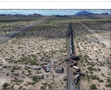
سانحه قطار در مکزیک