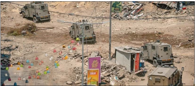
پس از تشدید اوضاع کرانه باختری و گسترش عملیات‌های مقاومتی در این منطقه، صهیونیست‌ها به شدت نگران وقوع انتفاضه سوم فلسطین هستند