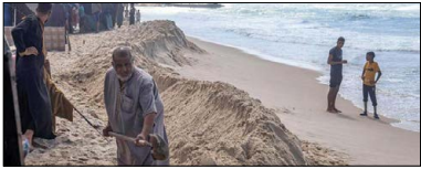
آوار گان در خان بونس نوار غزه در حال ایجاد تپه های شنی برای جلوگیری از نفوذ آب به چادر هایشان

باراک اوباما، بیل کلینتون، میشل اوباما و هیلاری کلینتون آماده اند تا با تمام توان از معاون رئیس جمهور فعلی حمایت کنند. باراک اوباما قصد دارد هفته آینده در لس آنجلس میزبان مراسمی برای جمع آوری کمک مالی باشد. او همچنین برنامه های بزرگتری برای ماه آینده در نظر گرفته است. بیل کلینتون توجه خود را به مناطق روستایی معطوف کرده است. به گفته مشاوران، او به ویژه روی ایالت جورجیا و مناطق صنعتی سابق تمرکز خواهد کرد. همچنین احتمال می رود کلینتون