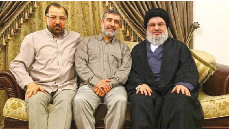
انتشار برای نخستین بار | تصویری از سردار حاجی‌زاده در کنار شهیدان نصرالله و فؤاد شکر