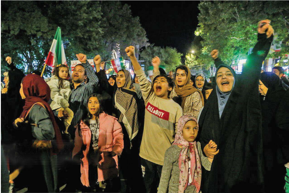
شادی مردم کشورمان در پی حمله سپاه به رژیم صهیونیستی

همزمان، رزمندگان حزب ا... لبنان در پاسخ به جنایات وحشیانه و مستمر رژیم صهیونیستی علیه ملت‌های فلسطین و لبنان، مناطق شمالی فلسطین اشغالی از جمله حیف و نهارپا را زیر ضربات سنگین موشک‌های خود قرار دادند. در این بین، هیئت هماهنگی مقاومت عراق با انتشار بیانیه‌ای اعلام کرد که اگر آمریکایی‌ها در هر اقدام خصمانه‌ای علیه جمهوری اسلامی دخالت کنند یا دشمن صهیونیستی از حریم هوایی عراق برای انجام هرگونه عملیات استفاده کند، همه پایگاه‌ها و منافع آمریکا در عراق و منطقه هدف ما خواهد بود.