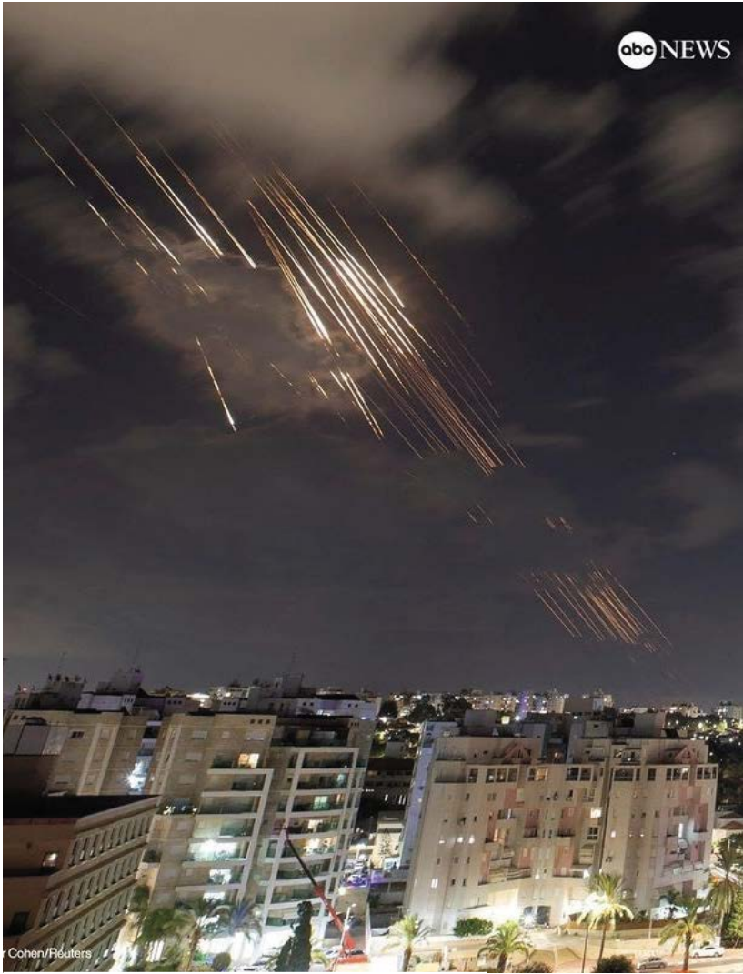
تصویر abcnews از لحظه ورود موشک های ایران به آسمان فلسطین اشغالی