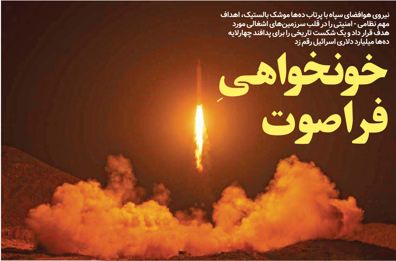
لحظه شلیک موشک‌های عماد به قلب سرزمین‌های اشغالی

نیروی هوافضای سپاه با پرتاب ده‌ها موشک بالستیک، اهداف مهم نظامی - امنیتی را در قلب سرزمین‌های اشغالی مورد هدف قرار داد و یک شکست تاریخی را برای پدافند چهارلایه ده‌ها میلیارد دلاری اسرائیل رقم زد