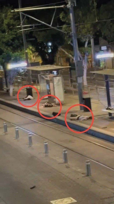
عملیات سپاه همزمان با عملیات استشهادی در قلب تل‌آویو با هلاکت ۴ صهیونیست آغاز شد