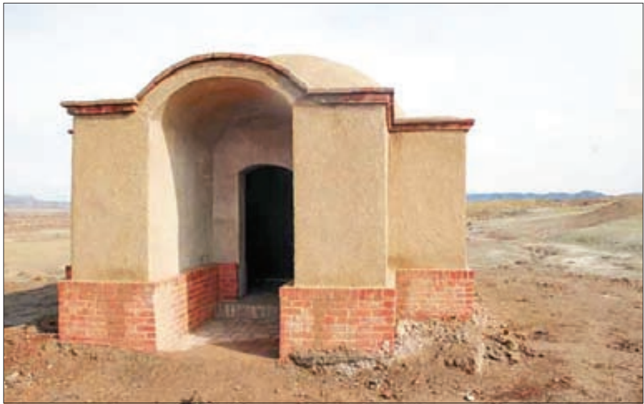
آرامگاهی منسوب به شیخ حسن جوری در نزدیکی روستای فرمند (سبزووار)