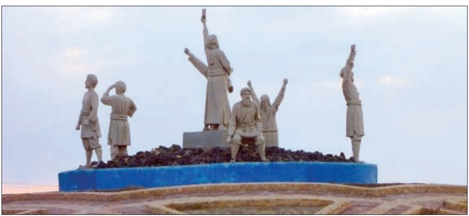
نماد سربداران در یکی از میدان های ورودی شهر سبزووار

آغاز شد که اندیشه های شیخ خلیفه و شیخ حسن جوری در تمام نواحی شمالی خراسان منتشر شده و پیروان فراوانی یافته بود.