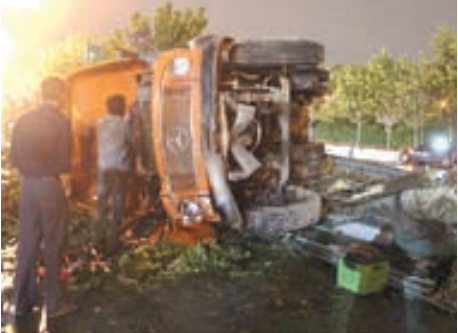
ولا گونی کامیون صبح روز گذشته در بزرگه‌مته تهران