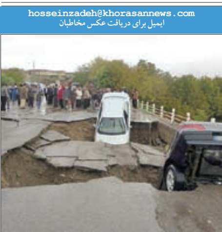
تصویری از حادثه سیل در ایلام