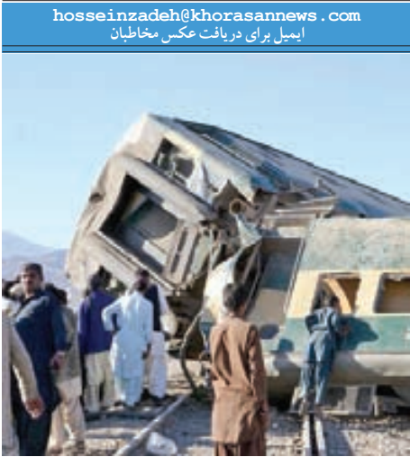
شمار کشته‌های سانحه قطار در پاکستان به ۱۹ تن رسید