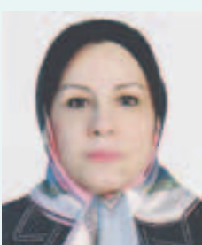
بدین وسیله درگذشت