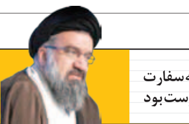
آیت‌الله محمد باقر محمدتقی‌مکرم‌الله