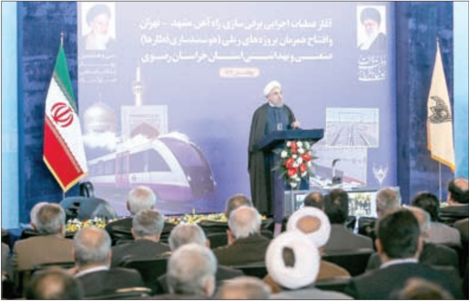
دفتر عملیات اجرایی برقی سازی راه آهن مشهد - تهران