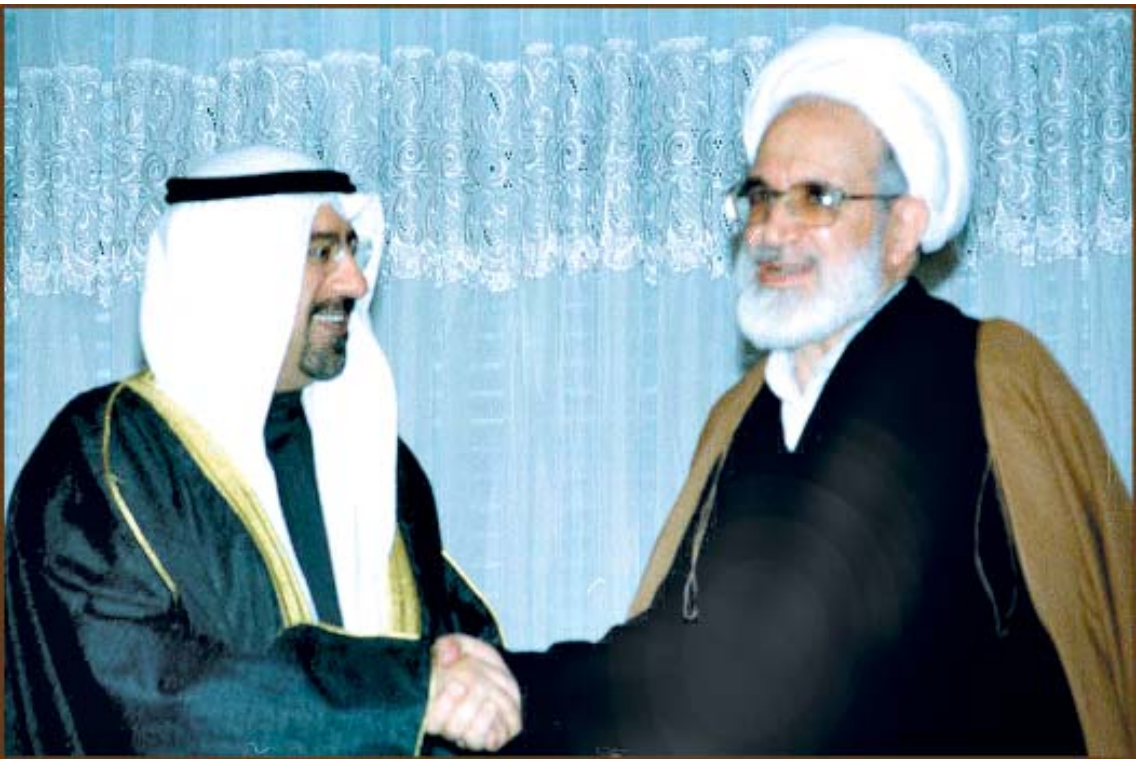
دیدارکروبی و وزیرمشاور در امور خارجه کویت

گروه سیاسی محمد صباح السالم الصباح وزیر مشاور در امور خارجه کویت روز یکشنبه با مهدی کروبی رئیس مجلس شورای اسلامی دیدار و گفت و گو کرد. ایرنا خبر داد: به گزارش اداره کل فرهنگی و روابط عمومی مجلس، آقای کروبی دراین دیدار بابراز خرسندی از روند بهبودی و سلامتی امیر کویت، سیاست جمهوری اسلامی ایران مبنی بر تنش زدایی، اعتمادسازی و استمرار روابط خوب و مناسبات حسنه با کشورهای همسایه به ویژه کشور دوست و برادر کویت را به عنوان سیاست راهبردی و استراتژیک مورد تاکید قرار داد.