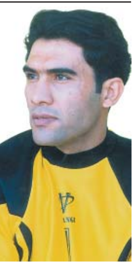
گروه ورزش: عامل:

وی با اشاره به اینکه درابتدای گسترش این رشته برنامه ریزی حائز اهمیت تر از بودجه بوده است افزود : اما اکنون نسل جدید نسبت به این رشته علاقمند شده و برای تداوم این روند فدراسیون ورزشهای باستانی و کشتی