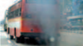
ایسنا-سازمان جهانی بهداشت(WHO) با هشداری نسبت به خطر آلودگی هوادر شهرهای جهان اعلام کرد: آلودگی هوا اکنون در سراسر جهان به‌وضعیت اضطرار برای سلامت عمومی تبدیل شده‌است.مدیر بخش سلامت عمومی سازمان جهانی بهداشت گفت: اگرچه تأثیرات کوتاه مدت آلودگی هوایر سلامت ساکنان شهرهای می‌تواند جدی باشد اما دلاوم یافتن آن نیز همچون بمب ساعتی برای سلامت عمومی عمل می‌کند.