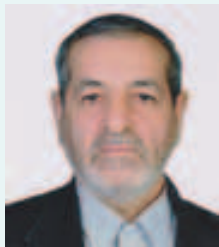
پدینوسبله در گذشت بزرگ خاندان