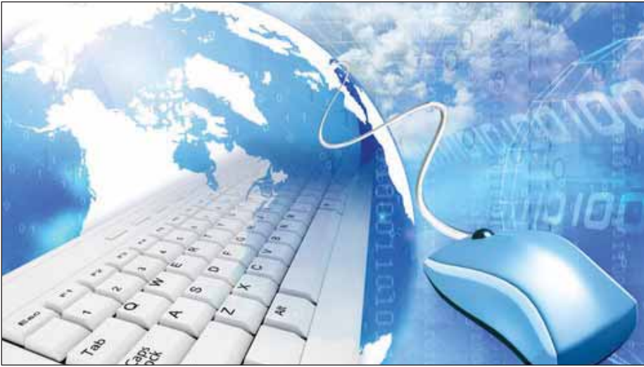
امروزه فناوری اطلاعات و ارتباطات فضایی را به وجود آورده که دنیا را در کمیت و کیفیت دچار تحولاتی عمیق کرده است.

رئیس سازمان حفاظت محیط زیست گفت: تاکنون مطالعاتی که اثبات کند اشخاصی جان خود را بر اثر آلودگی هوا از دست داده‌اند، وجود ندارد و بیان موضوع‌های کارشناسی در رسانه‌ها درست نیست و بهیچ وجه مردم را نگران نمی‌کند. به گزارش فارس محمدی زاده در باره آلودگی خطرناک مونوکسید کربن گفت: نتایج تمام بررسی‌ها نشان می‌دهد وضع موجود و به بهبودی است؛ به ویژه ذرات زیر ۱۰ میکرون (معلق هوا) بهیچ‌پیدا کرده است.