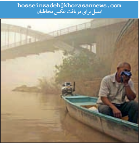
هوای غبار آلودهوا در روز اول اسفند