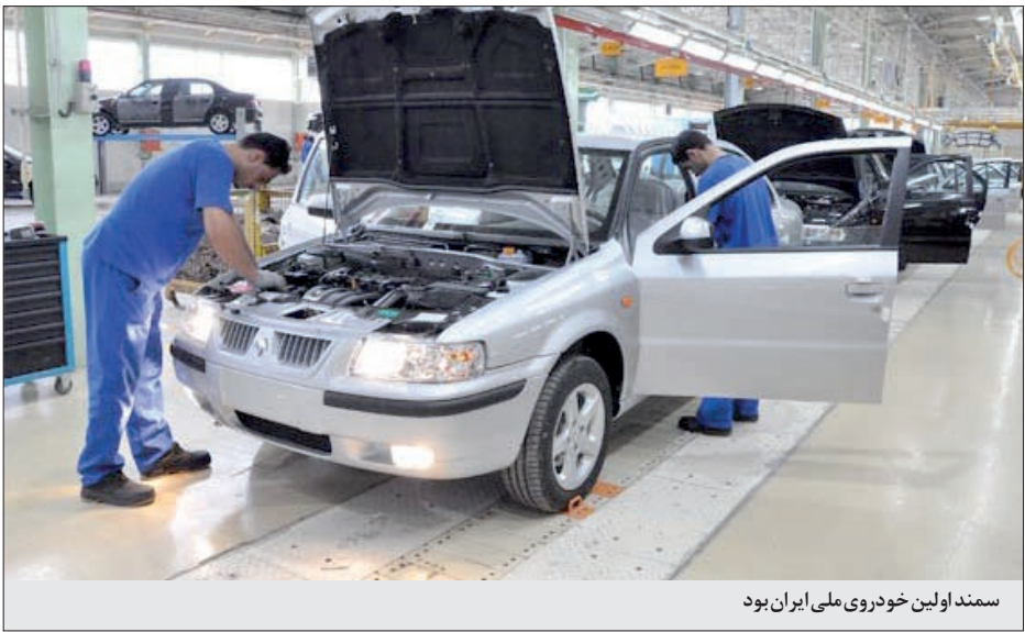
سمند اولین خودروی ملی ایران بود

سال ها برای جبهه های جنگ انواع خودرو تولید می کرد. آغاز همکاری با شرکت «نیسان» ژاپن و تولید خودروی «نیسان پاترول» در سال ۱۳۶۵ نقطه عطف دیگری در تاریخ خودروی ایران بود. در سال ۷۱ جپ «صحر» وارد بازار شد و بعدتر پارس خودرو با فروش ۵۱ درصد سهام، در مالکیت شرکت سایپا قرار گرفت.