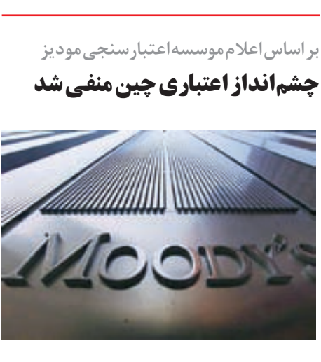
چشم انداز اعتبار سنجی مودیز

کارفرمای پروژه اداره راه و شهر سازی استان گیلان است و پروژه فاز به فاز قابل بهره برداری می باشد. این شرکت اعلام کرده هر زمان جزئیات قرار داد مشخص شود، آن را به بازار اعلام خواهد کرد، اما به نظر بعید می رسد که این مهم برای سال ۹۵ تأثیری داشته باشد.