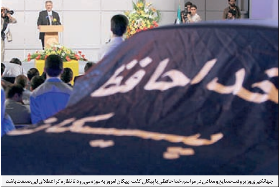
جهانگیری وزیر وقت صنایع و معادن در مراسم خدا حافظی با پیکان گفت: پیکان امروز به موزه می رود تا نظاره ر اعطای این صنعت باشد

به صورت مشترک با تیمی خارجی به انجام محاسبات