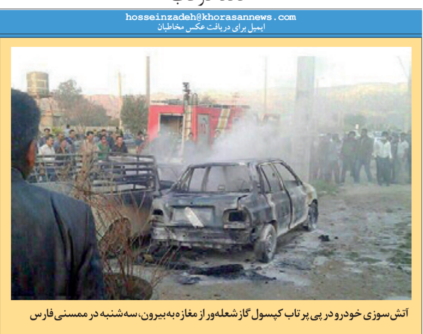
آتش سوزی خودرو در پی برتاب کپسول گاز شعلهور از مغازه به بیرون، سه شبه در ممسنی فارس