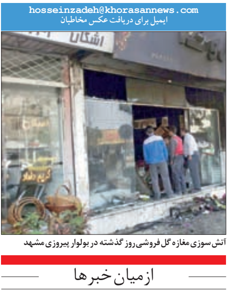
آتش سوزی مغازه گل فروشی روز گذشته در بولوار پیروزی مشهد