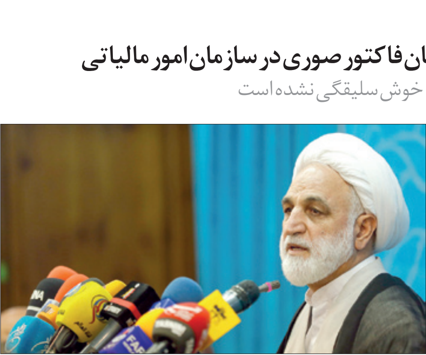
قالیباف در جریان نشست خبری