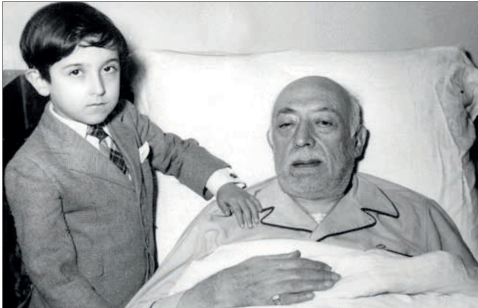
احمد قوام در اواخر عمر همراه با تنها فرزندش که او نیز در جوانی در گذشت.

به نوشته «محمود طلوعی» در «بازیگران عصر پهلوی»، «این اعلامیه شدیداللحن که بدون مطالعه جوانب امر و انعکاس آن در جامعه منتشر آن روز ایران منتشر شد، آخرین اثر مکتوب و بزرگ‌ترین خطای سیاسی قوام السلطنه به شمار می‌آید»؛ اشتباهی که به منزله پایان حیات سیاسی «احمد قوام» بود. او روز ۳۱ تیرماه سال ۱۳۳۲ هـ. ش، استعفاداد و برای همیشه از صحنه سیاسی کشور خارج شد و درست دو سال بعد، در ۳۱ تیرماه سال ۱۳۳۴ هـ. ش، در ۸۲ سالگی، در گذشت.