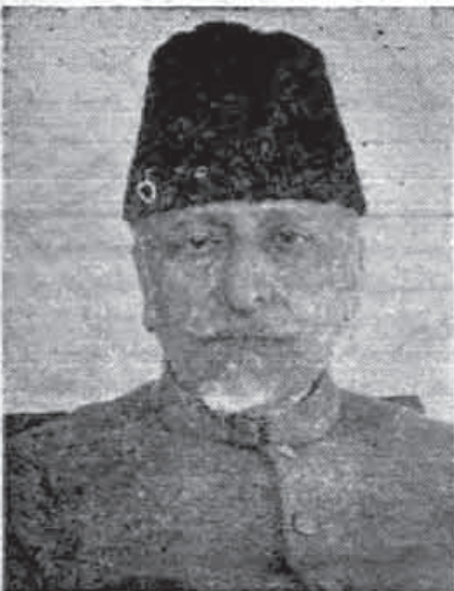
مولانا ابوالکلام آزاد

و مهمان گرمی دولت ایران مبارزهٔ این شخص در راه آزادی هند سبب شده که یازده سال از عمر خود را در زندان بسر ببرد - تالیفات مولانا پس از نوشته های مهاتما گاندی در درجه اول اهمیت قرار دارد