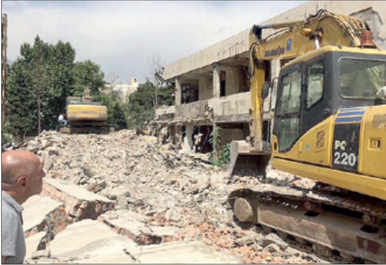
تخریب خانه تاریخی توران در تهران- ۱۲ روز قبل