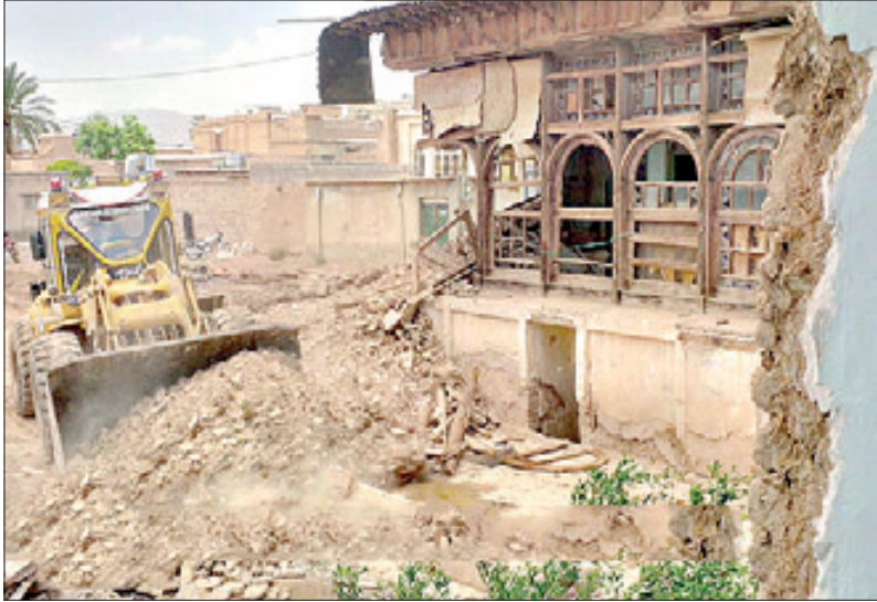
تخریب خانه شاهپور کریمی- شهرستان فسا- ارد بهشت ۹۴