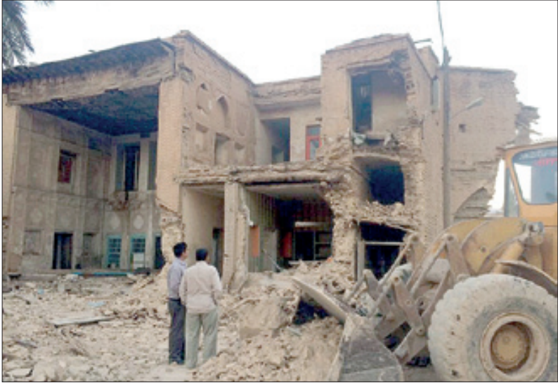
تخریب خانه حلی‌ساز در شیراز-۹۳