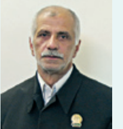
ولافره خیرک من الاولی

بار دیگر موسم خاطر گزند مراد ماه فرامی‌رسد ماما هنوز سوگمند هجران پدر و مراد مهرآور خود هستیم. هفتمین سالگرد ارتحال خادم الرضا (ع) روانشاد