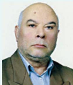
تنها اوست که می ماند بدین وسیله در گذشت بزرگ خاندان