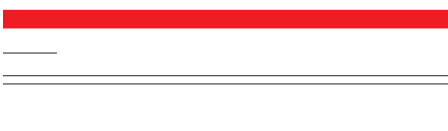
تسنیم: آیت... مکارم برای پایان اعتصاب غذای سه ماهه شیعیان پاکستان

فائقی- سخنگوی شورای نگهبان در حالی از برگزاری نشست مشترک این شورا با هیئت رئیسه مجلس برای اصلاح قانون انتخابات در آینده نزدیک خبر داده است که اخیرا خبری تایید نشده‌از وجود طرحی مبنی بر اینکه هر رئیس جمهور صرفاً برای حداکثر دو دوره چهار ساله حق تصدی ریاست جمهوری را داشته باشد حکایت می‌کرد، این درحالی است که کدخدائی سخنگوی شورای نگهبان طرح محدود کردن نامزدی روسای جمهور سابق را تکذیب کرد. به گزارش سایت خبری «پایش»، برخی فعالان سیاسی اصولگرا اخیراً از برخی رایزنی‌ها با شورای نگهبان و رئیس مجلس شورای اسلامی سخن می‌گویند که هدف از آن، محدود کردن حضور روسای جمهور سابق در انتخابات است، به گونه‌ای که افراد صرفاً برای حداکثر ۲ دوره چهار ساله حق تصدی ریاست جمهوری را داشته باشند. پیش از این هاشمی رفسنجانی بعد از دو دوره ریاست جمهوری در سال ۸۴ مجدداً نامزد انتخابات شد و اکنون نیز گمان می‌رود محمود احمدی نژاد در حال آماده شدن برای رقابت‌های انتخاباتی سال آینده باشد. در همین حال عباسعلی کدخدایی در گفت و گو با «پایش»، با تکذیب خبر طرح محدود کردن حضور روسای جمهور سابق در انتخابات گفت: در طرح اصلاح قانون انتخابات که درباره رای‌زنی‌هایی با مجلس صورت