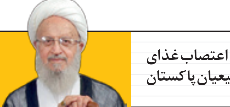
تسنیم: آیت... مکارم برای پایان اعتصاب غذای سه ماهه شیعیان پاکستان

هادی محمدی - رحمانی فضلی در پاسخ به سوالی در مورد موضوع پول های کثیف، به اظهارات اخیر در مورد خرید و فروش رای اشاره کرد و افزود: حتی آیت... جنتی هم به جریان ورود کرد و خرید و فروش رای را تایید نمود البته آن دولت در موضوع پولشویی وار د شده در شورای عالی پول شویی این بحث را دنبال می کند. به گزارش خراسان رحمانی فضلی دیروز در نشست بزرگداشت روز خبرنگار همچنین ضمن تبریک این روز به اصحاب رسانه، در مورد پیامک های تهدیدآمیز علیه خبرنگاران گفت: من به نیروی انتظامی دستور بررسی دادم امروز گزارش این موضوع به بنده نرسیده است. به گزارش ایران‌وی در باره بحث خرید و فروش رای و اظهارات اخیر آیت... جنتی و اقدام قانونی در این زمینه گفت: شکایت های متعددی در حین انتخابات از طرف نمایندگان به ما می رسید که در حد اختیارات خود بر خورد می کنیم وی افزود: لایحه دوفوریتی در این زمینه به مجلس ارائه شده است تا این روش می توان این مسئله را کنترل کرد. وزیر کشور تاکید کرد: در حال حاضر دولت بر موضوع پولشویی متمرکز شده، اقدام هایی شروع کرده است و با دقت پیگیری می کند، خبرنگاران نیز باید این موضوع را پیگیری کنند. به گزارش خبرآنلاین، وزیر کشور همچنین در پاسخ به این سوال که برخی شخصیت های سیاسی مثل آقای احمدی نژاد تحت ر کات و سفرهای انتخاباتی خود آرا آغاز کرده‌اند، آیا وزارت کشور این تحرکات و سفرها را رصد خواهد کرد و