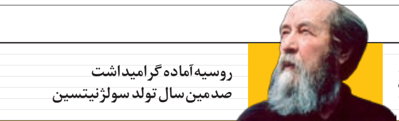
روسیه آماده گر امیداشت

وزیر ارشاد با اشاره به لغو ۹ کنسرت از ابتدای سال ۹۵ تاکنون تاکید کرد تعداد کنسرت‌های لغو شده اسمال چندان زیاد نیست.به گزارش خبرنگاران،علی جنتی در بخش گفت‌وگوی ویژه خبری شبکه دوم تاکید کرد: کار وزارت ارشاد فقط برگزاری کنسرت نیست و یادآور شد آنچه موجب دامن زدن به فضای حواشی در زمینه کنسرت‌هایم‌شود،برخی سایت‌های بی‌شناسنامه است. جنتی افزود: یکی از عوامل دامن زدن به این موضوعات راسایت‌هایی می‌دانم که بسیاری از آن‌ها بدون شناسنامه هستند، ما در گزار ی کنسرت‌ها نهایت دقت را می‌کنیم تا موازین شرعی و قانونی رعایت شود. اما در برخی موارد کنسرت‌های خوانندگانی لغومی‌شود که مورد تایید ما هستند، در رسانه ملی صدایشان بخشی می‌شود که حاشیه ایجاد می‌کند.برخی مواقع این مخاطبان کنسرت‌ها هستند که حدود لازم را رعایت نمی‌کنند. وزیر ارشاد درباره فیلم «قصه‌ها» گفت: بارها در کمیسیون فرهنگی مجلس،تاکید کردم این فیلم را شخصاً دیدم و هیچ مشکلی ندارد. این فیلم در داخل ایران اکران شد و هیچ مشکلی نداشت، اگر در خارج نیز فته هیچ مشکلی ندارد. جنتی درمورد ۵۰ کیلوآلبالو» اظهار کرد: این فیلم را شورای نظارت بر نمایش تایید کرده بود. پس از تماشای فیلم دیدم برخی انتقادات به آن وارد است. من یک اظهار نظر شخصی کردم اما این فیلم بر خودنشدن‌شود پرده سینماپایین کشیده‌اند. فیلم‌هایی که ارزشی نیستند، مورد حمایت ما نیستند بلکه وزارت ارشاد فقط روی محتوای آن‌ها نظارت می‌کند. او با بیان این که فیلم‌های سینمایی خارجی در داخل کشور به نمایش گذاشته نمی‌شود، افزود: او می‌شود. اما چون از طرف وی پاسخ مثبت ن‌دارند و قابل اجرا نیستند که جلوی آن‌ها گرفته می‌شود.