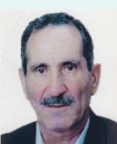
بازگشت همه به سوی اوست بانهایت تاتر و تاسف درگذشت شادروان بزرگ خاندان