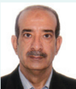
انالله و انا الیه راجعون بانهایت تاسف و تاتر درگذشت مرحوم مغفور شادروان