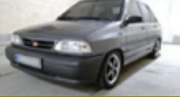
سجادپور- ماموران کلانتری طبرسی جنوبی مشهدسارق۴۷ ساله‌ای را دقایقی بعد از سرقت یک دستگاه پراید خاکستری رنگ به دام انداختند. به گزارش خراسان، جوان ۲۰ ساله‌ای هر اسان خودرو را خودروی گشت پلیس رساندو گفت: خودرو پرایدم در حالی که قفل بدال نیز داشت از خیابان خشنودی سرقت شده است. ماموران انتظامی قایقی بعدسارق را در یکی از خیابان‌های اطراف دستگیر کردند.