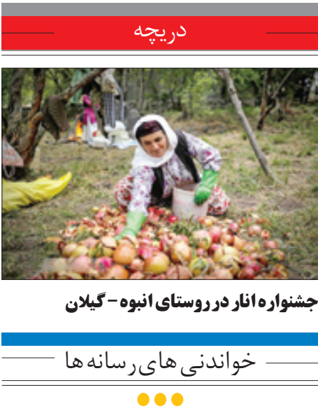
جنسواره انار در روستای انبوه- کیلان

دولت افغانستان ودفتر جرایم و مواد مخدر سازمان ملل، گزارش داده‌اند که تولید مواد مخدر افغانستان در سال جاری میلادی ۴۳ در صد افزایش یافته است. بر اساس این گزارش مشترک سالانه که دیویژیکشنیه منتشر شد در سال ۲۰۱۶ مقدار مواد مخدر تولید شده افغانستان به صورت تخمینی به ۴۸۰۰ تن رسیده‌است در حالی که این آمار سال گذشته ۳۳۰۰ تن بوده است. به گزارش بی‌بی‌سی،، بنابر این گزارش، مجموع مساحت زمین زیر کشت هم از ۱۸۰ هزار هکتار در سال ۲۰۱۵ به ۲۰۱ هزار هکتار در سال جاری رسیده است. این گزارش بیانگر آن است که امسال از یک سومیزان تلاش‌ها برای ریشه کنی مواد مخدر کاهش داشته و از سوی دیگر، کشت تریاک هم بیشتر شده و به طور متوسط از ۱۸.۳ کیلوگرم در هکتار در سال گذشته به ۲۳.۰ کیلوگرم در هکتار در سال جاری رسیده است. از سال ۱۹۹۴، امسال برای سومین بار مساحت زمین زیر کشت تریاک در افغانستان به بالای ۲۰۰ هزار هکتار رسیده‌است. نخستین بار در سال ۲۰۰۹ این آمار به ۲۰۹ هزار هکتار رسید و در ۲۰۱۴ این آمار ۲۲۴ هزار هکتار بود. از سال ۲۰۰۲ به این سو، کشت و تولید مواد مخدر در افغانستان پیوسته در حال افزایش بوده‌است. بنابر گزارش تازه دفتر در باره آن مواد مخدر سازمان ملل ووزارت مبارزه با مواد مخدر افغانستان، بیشترین مقدار مواد مخدر افغانستان در مناطق جنوبی (۵۹ درصد) و شرقی (۲۵ درصد) تولید می‌شود. وزارت مبارزه با مواد مخدر افغانستان کوتاهی در ریشه کنی کشت تریاک در سال جاری را به افزایش ناامنی و تاخیر در دریافت هزینه کمکی در این مورد نسبت داده‌است.