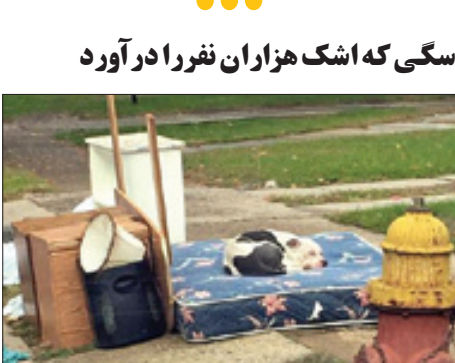
سگی که اشک هزاران نفر را در آورد