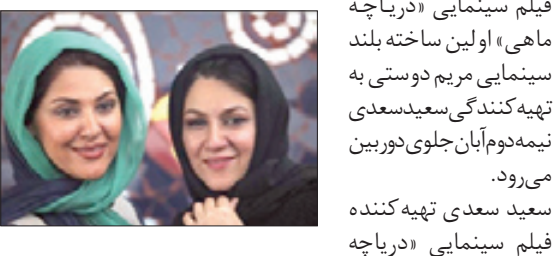
فیلم سینمایی «دریاچه