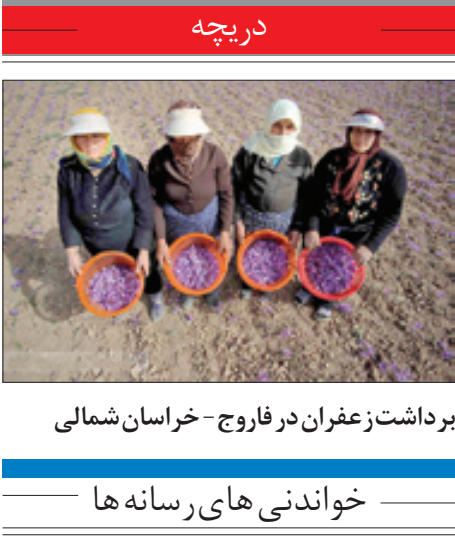
برداشت زعفران در فاروج - خراسان شمالی