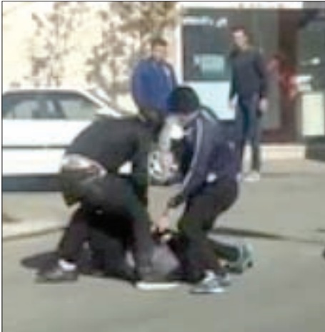
تصویری از قبلمی که کلر لحظتور گیری در منطقه ۱۸ محله خلیج فارس تهران، در خبر گزار ی باشگاه خبر نگاران منتشر شد.