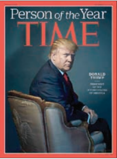
ترامپ به‌عنوان مرد سال ۲۰۱۶ مجله تایم انتخاب‌شد. در روی جلد نوشته‌شده «ترامپ رئیس‌جمهور ایالت متفق‌به‌امریکا».

رئیس‌جمهور منتخب آمریکا گفت که سیاست «مداخله و هرج و مرج» باید پایان یابد. دونالد ترامپ بر این اساس سیاست نظامی خود را به جای «تهاجم» بر مبنای «بازدارندگی» تعریف کرد. به گزارش ویتنر، دونالد ترامپ در جریان سفرهای «قدر دنی» خود، میهمان شهر «فایت ویل» ایالت «کارولینای شمالی» بود که «فورت برگ» پر جمعیت ترین پایگاه نظامی جهان را در خود جای داده است. او در میان هوادارانش گفت که سیاست نظامی دولت آینده مبتنی بر «رهیز از مداخله در مناقشات خارجی، تمرکز بر شکست داعش و دستیابی به صلح از طریق تقویت قدرت بازدارندگی نظامی» خواهد بود. ترامپ همچنین، در جمع هواداران پر شمارش را به سوزن‌نزدیکی پایگاه نظامی فورت برگ (Fort Bragg) گردآمده بودند، ژنرال جیمز متیس، وزیر دفاع دولت خود ا معرفی کرد. آمریکا سربازان خود را از این پایگاه نظامی به ۹۰ کشور دنیا اعزام کرده است. او در سخنانی در این مکان، همانند تبلیغات دوران انتخابات خود بر اشتباه بودن حمله نظامی به عراق و مداخله نظامی در خاور میانه تأکید کرد و گفت: «ما دیگر در پی سرنگونی رژیم‌هایی که هیچ شناختی از آنها نداریم، نخواهیم بود و به این اقدام‌ها نیز دخالت نخواهیم کرد. تمرکز ما در عوض بر شکست تروریسم و نابودی داعش خواهد بود.» وی همچنین بابیان اینکه هزینه‌هایی را که