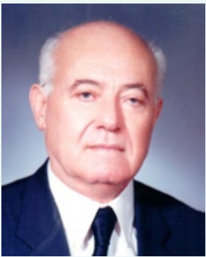
سومین سالگرد عزیز از دست رفته مان