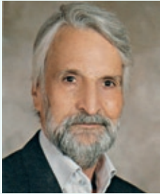
تشکر و قدردانی

بدین وسیله از الطاف تمامی بستگان، دوستان و سروران گرامی، اساتید، دانشگاهیان و فرهنگیان گرانقدر، جامعه محترم پزشکی و مهندسی استان، همکاران اداره مخابرات مشهد مقدس که ما را در سوگ از دست دادن پدری دلسوز و همسری مهربان