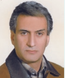
تشکر و قدردانی

بدین وسیله از کلیه سروران عزیزی که در مراسم تشییع و خاکسپاری و مساجد مرحوم