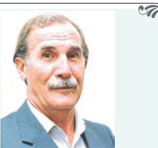
بنام حضرت دوست

خدا جو صورت و ابروی دلگشای تو بست شاده کار من اندر کرشمه های تو بست خیال روی تو در هر طریق همزه ماست