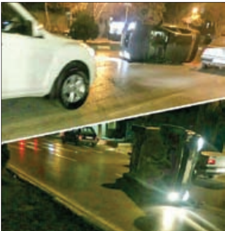
حادثه رانندگی خودروی سوار در بولوار اقبال لاهوری مشهد