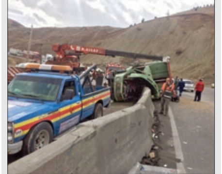
مرگ‌راننده کامیون در تصادف با پژو ۲۰۶ در جاده تهران- جاجردود