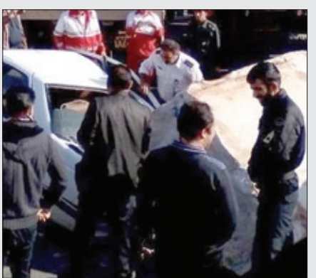
بی توجهی به جلوراننده تریلر موجب برخورد با کامیون جلویی شد. بار سنگ تریلر بسته نشده بود سنگ بر روی صندوق یک خودروی سواری پرایدافتاد البته این تصادف خسارت جانی نداشت.