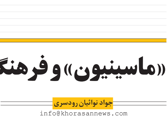
جواد نوائیان رودسری