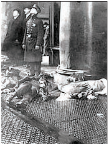
کارخانه نساجی نیویورک و اجساد کارگران

و روز کنترل دستگاه های سوختی محل سکونت شان قید شده است و در دهه های اخیر قانون، وظایف بیشتری را به دودکش پاک کن ها در آلمان محول کرده است. یکی از این وظایف تشخیص و ثبت میزان مجاز گاز های خروجی از دستگاه های حرارتی است. اگر کسی در آلمان شومینه یا بخاری چوبی خریداری کند، دستگاه توسط شرکت فروشنده نصب می شود. اما تازمانی که توسط «شورناشتاین فگر» کنترل نشود، اجازه استفاده از آن را ندارد. «شورناشتاین فگر» های آلمانی حتی موظف به کنترل «نم ویا میزان» آب موجود در چوب که قرار است در شومینه یا بخاری چوبی سوخته شود نیز هستند. چوب فرستی برای جبران باقی نگذازد.