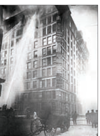
کارخانه نساجی نیویورک و اجساد کارگران

و روز کنترل دستگاه های سوختی محل سکونت شان قید شده است و در دهه های اخیر قانون، وظایف بیشتری را به دودکش پاک کن ها در آلمان محول کرده است. یکی از این وظایف تشخیص و ثبت میزان مجاز گاز های خروجی از دستگاه های حرارتی است. اگر کسی در آلمان شومینه یا بخاری چوبی خریداری کند، دستگاه توسط شرکت فروشنده نصب می شود. اما تازمانی که توسط «شورناشتاین فگر» کنترل نشود، اجازه استفاده از آن را ندارد. «شورناشتاین فگر» های آلمانی حتی موظف به کنترل «نم ویا میزان» آب موجود در چوب که قرار است در شومینه یا بخاری چوبی سوخته شود نیز هستند. چوب فرستی برای جبران باقی نگذازد.