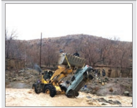
رها سازی پواید از سیلاب درایر (کرمان)