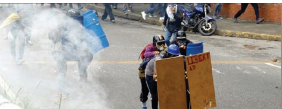
تظاهرات در کاراکاس در ۲۰۱۷ میلادی

در ادامه اعتراض به تصمیمات دولت نیکلاس مادورو از محله تلاش برای اعمال تغییر در قانون اساسی ونزوئلا، مخالفان دولت اعلام کردند که تظاهرات اعتراضی بزرگی علیه این تصمیم دولت در کاراکاس، بزرگترین شهر ونزوئلا، در جریان است. اعتراضات علیه دولت مادورو در ونزوئلا از روز سه‌شنبه که رئیس‌جمهور این کشور از تصمیم خود برای تشکیل یک نهاد جدید با هدف بازنویسی قانون اساسی خبر داد، وارد مرحله تازه‌ای شد. مادورو می‌گوید که این نهاد جدید «مجلس ملی» خواهد بود، اما هم‌راستا مخالفان می‌گویند که تاسیس این نهاد جدید با وجود مجلس قانونی در کشور نوعی «کلاهبرداری قانونی» است. در همین زمینه خبرگزاری فرانسه به نقل از فردی گوئوارا، نایب رئیس مجلس ملی ونزوئلا گزارش داد که رئیس‌جمهور به دنبال «قبضه کردن قدرت»