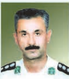
در نهمین سالگرد شهادت

سرهنگ شهید محمدتقی حماری شهادت پرازنده قامت رعنایت و آندوه فراقت نا اید در دلهايمان باقي و مهربانی ات در خاطره ها به یادماندی است. ۱۳۹۶-۰۳-۲۳