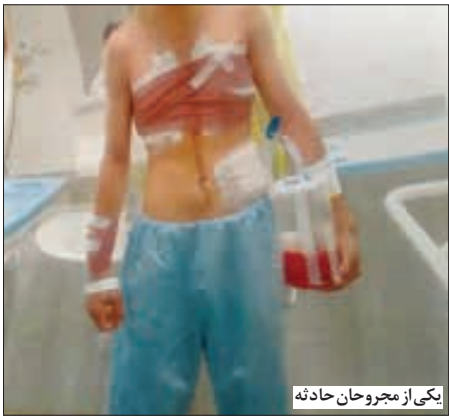
یکی از مجروحان حادثه

قدرتی پوشالی به دست آوردند، باندند که قدرت قانون، آنان را در هم می شکند چرا که دیگرز مان قداره بندا به پایان رسیده است و دستگاه قضایی با عاملان هر گونه بی نظمی و شرارت با قاطعیت تمام بر خور د خواهد کرد. گزارش خراسان حاکی است: فرمانده انتظامی مشهد نیز با اشاره به این که تاکنون ۵ تن از متهمان پرونده شرارت و نزاع های مسلحانه در مشهد دستگیر شده اند به خراسان گفت: «الف-م» که خالکوبی های متعددی نیز روی بدش دارد، تحت تعقیب نیروهای نظامی و انتظامی بود که در نهایت با انجام یکسری فعالیت های اطلاعاتی و پلیسی توسط گروه زده ای از ماموران عملیات ویژه در چنگ قانون گرفتار شد. سرهنگ محمد بوستانی افزود: ۳ تن از دستگیرشدگان در این پرونده برادر هستند که به دلیل نزاع با سلاح های سرد و گرم تحت تعقیب بودند. متهمان این پرونده یکی از شاکیان را با ۲۷ ضربه چاقو مجروح و