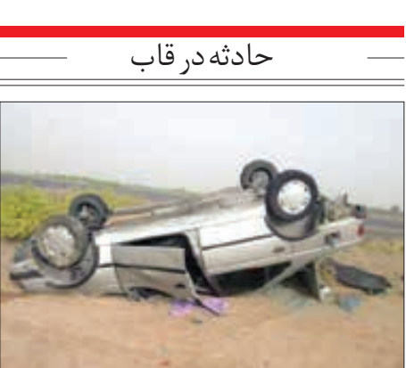
واژگونی پژو در کوهپایه اصفهان ۳ قربانی گرفت