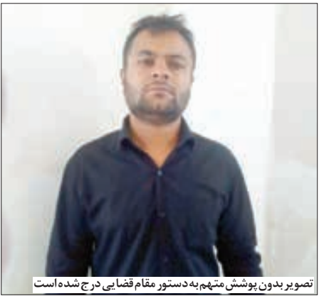
تصویر بدون پوشش متهم به دستور مقام قضایی درج شده است

سلاح سرد به طور وحشتناکی با یکدیگر در گیر می‌شوند که همین موضوع به کینه و انتقام جویی می کشد. قاضی ویژه رسیدگی کننده به جرایم خاص در مشهد یادآور شد: درحالی که بر سرسی هانشان می داد عاملان نزاع مذکور از افراد شرور و تحت تعقیب نیروهای امنیتی هستند، گروهی از ماموران عملیات ویژه پلیس مشهد با صدور دستورات قضایی به ردیابی متهمان پرداختند تا این که برخی خود را تسلیم پلیس کردند اما صدهای اطلاعاتی برای دستگیری شرور معروف همچنان ادامه داشت تا این که وی نیز روز گذشته وقتی همراه‌های گریزرا بسته دید، خود را به نیروهای انتظامی معرفی کرد. قاضی سید جواد حسینی با تاکید بر این که دستگاه قضایی با عاملان اخلا در نظم عمومی و شرارت بر خور د قاطعی خواهد داشت، گفت: افرادی که احساس می کنند با انجام شرارت و چاقو کشی می توانند برای خودشان