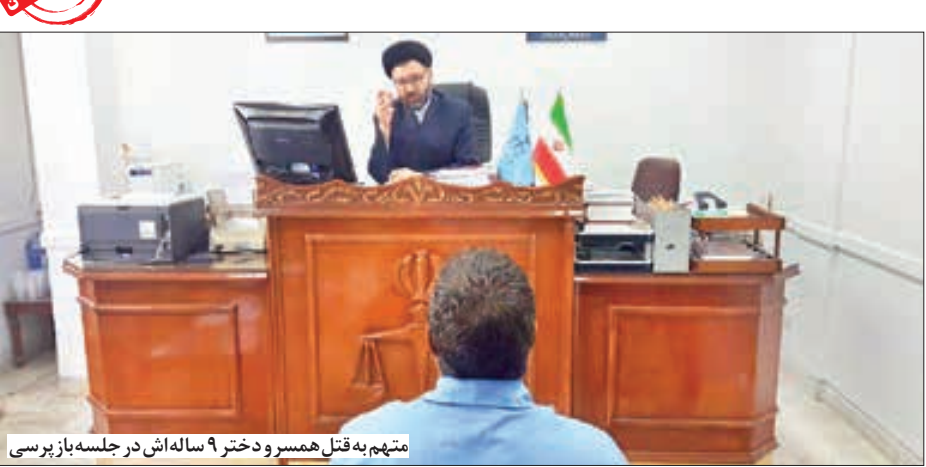
متهم به قتل همسر و دختر ۹ ساله اش در جلسه باز پرسى