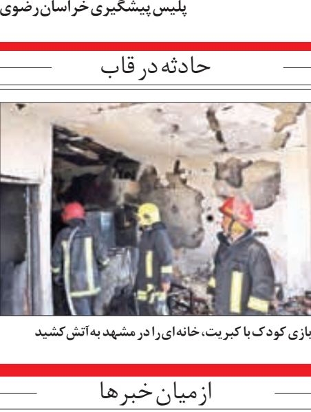
بازی کودک با کبریت، خانه‌ای را در مشهد به آتش کشید

• از سوار شدن به خودروی افراد غریبه خودداری کنید. • اسناد و مدارک معتبر، دسته چک و اموال با ارزش خود را در محلی مطمئن و دور از دسترس دیگران نگهداری کنید. • خودروی خود را به لوازم ایمنی نظیر دزدگیر، قفل فرمان، قفل پدال، قفل سوئیچی، سوئیچ مخفی و سایر وسایل تاخیری و بازدارنده مجهز کنید. • خودروی خود را حتی برای لحظه کوتاهی با موتور روشن یا با گذاشتن سوئیچ روی آن ترک نکنید.